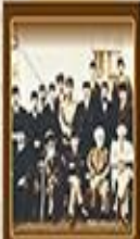
Ehliyetin Kaldırılması 20 Ocak 1921