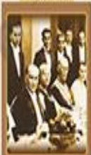
Halkın Kanunu Kabulü 4 Ekim 1926