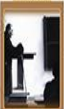
Tarıkçı, Baki ve Öyle Değişikliği 28 Aralık 1925