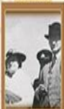
Kadınların Mahkemelerde Haklarına İhtilaf Kanunu 24 Ekim 1933