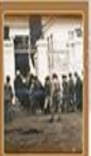
Seydi Baki İşyanı 13 Şubat 1925