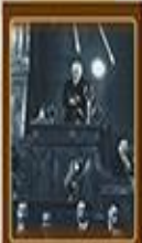
Cumhuriyet Halk Fırkası'nın Açılması 9 Eylül 1923