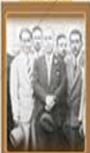
İstisnai Cumhuriyet Fırkası'nın Açılması 17 Kasım 1930