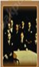
İhtilaf Kanunu 3 Mayıs 1930