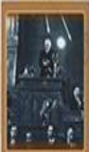
Teknik ve Teknikat Komisyonu 3 Mart 1924