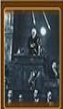
Cumhuriyetin Bate 29 Ekim 1923