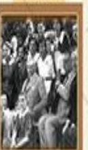
Kadınların Mahkemelerde Seçimine İhtilaf Kanunu 3 Aralık 1934