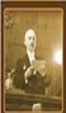
Tarıkçıların Cumhuriyet Fırkası'nın Açılması 17 Kasım 1924