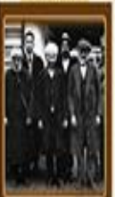
Meclis Kanunu 23 Aralık 1930