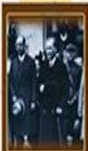
Türk Dil Kurumunun Açılması 12 Temmuz 1932