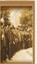
Türk Tarih Kurumu'nun Açılması 18 Mayıs 1931