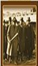
Kabahat Kanunu'nun Kabulü 1 Temmuz 1926