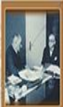
Teknik ve Esasî Yönlü Kabahat 20 Ocak 1921