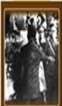
Yeni Türk Harflerinin Kabulü 1 Kasım 1928