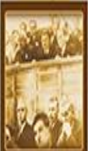
Tezisi Dikkat Konuşması 17 Şubat 1923