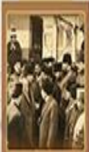
Mahkemelerin Kaldırılması 3 Mart 1923