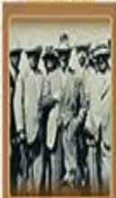
Teşkilat Kanunu 29 Kasım 1925