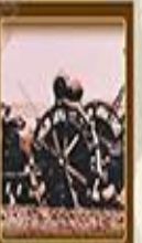
Ağır Öyleli Vergilerinin Kaldırılması 17 Şubat 1925