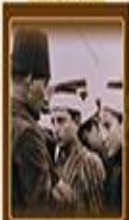
Teknik ve Zariyatında Kapalıların 30 Kasım 1925