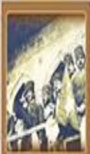
Ankara'ya İstisnai Olarak 13 Ekim 1923