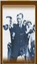
Kadınlara Belediye Seçimlerine Katılma Haklarının Verilmesi 3 Mayıs 1930