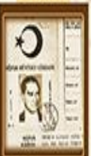
Seydi Kanunu 21 Mart 1934